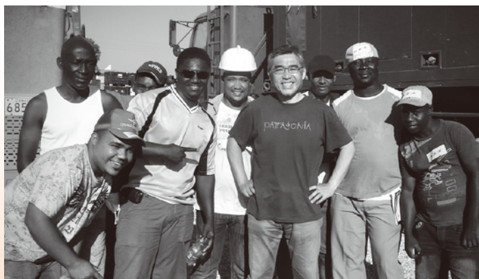
▲ハイチ大地震取材で現地スタッフと(右から4人目が筆者)

私はNHKの特派員として長年、国際報道に携わりました。駆け出しは事件記者でしたので、取材現場を海外に移しても、海外で起きる事件・事故や災害、紛争・戦争、貧困や飢餓、難民・移民、人種差別や民族問題など、かなりやっかいな？問題を現場から伝える仕事が多くなりました。特派員としてアメリカのロサンゼルス、ニューヨークには2回、中国の北京にも駐在し、世界50カ国あまりを取材しました。