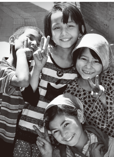
▲ウイグル人の子どもたち

まだ治療法が確立されていなかった90年代のアメリカで、取材する私の手を握りしめて離そうとしない死の床のエイズ患者。内戦が続いたエルサルバドルで、ただ静かな暮らしがしたいだけ、と語る元女性ゲリラ。月一度しかない配給の貴重な豚肉を全部使って、もてなしてくれたキューバの主婦。海外の現場を取材して、肌の色や外見が違って「人の心は、みな同じ」であることを、実感で知ることができました。