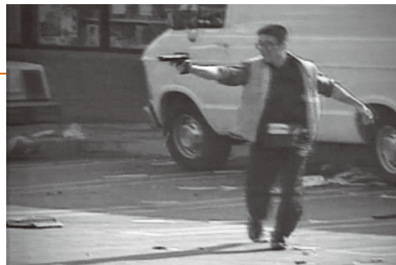
▲暴徒に応戦する韓国系店主 1992年ロサンゼルス暴動

たのは、トランプ大統領。人種・民族の多様化が進むアメリカは、中南米系やアジア系の人口がどんどん増えていて、建国以来ずっと