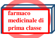
para uso general