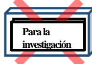
Para la investigación