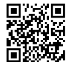
Manual Pengguna Ambulans