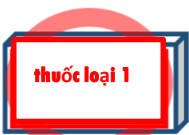
Dùng thông thường