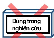
Dùng trong nghiên cứu

※Hãy sử dụng bộ xét nghiệm 「dùng trong y tế」 hoặc 「dùng thông thường」 không dùng bộ xét nghiệm 「dùng trong nghiên cứu」