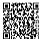
Corona chủng mới

※Thông tin liên quan tới vaccine tại đây