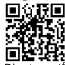
Dùng trong y tế

Danh sách các bộ dụng cụ kiểm tra đang được đăng tải