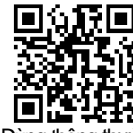
Dùng thông thường