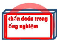
Dùng trong y tế