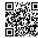
Cách sử dụng xe cấp cứu